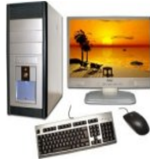
Računar sa osnovnim hardverom