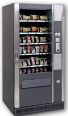
Automat za trgovačku robu

Od ugostiteljske opreme potrebno je nabaviti: automat za tople napitke, automat za sokove, automat za trgovačku robu, vitrinu za kolače i aparat za čuvanje sendviča.