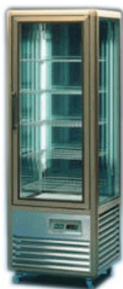
Vitrina za kolače