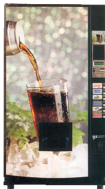
Automat za hladna pića