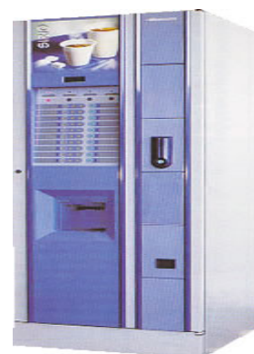
Automat za tople napitke