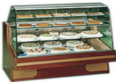
Vitrina za kolače