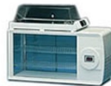
Aparat za čuvanje sendviča

Pored opreme potrebno je nabaviti inventar u dijelu namijenjenom za korištenje računara u koje ubrajamo: jedanaest stolova, jedanaest stolica, dva stola za štampač i skener; u dijelu za pružanje ugostiteljskih usluga: 15 stolova i 60 stolica, police za torbe, četiri vješalice, svjetiljke, inventar za sanitarni čvor, dva klima uređaja i tri protupožarna aparata.